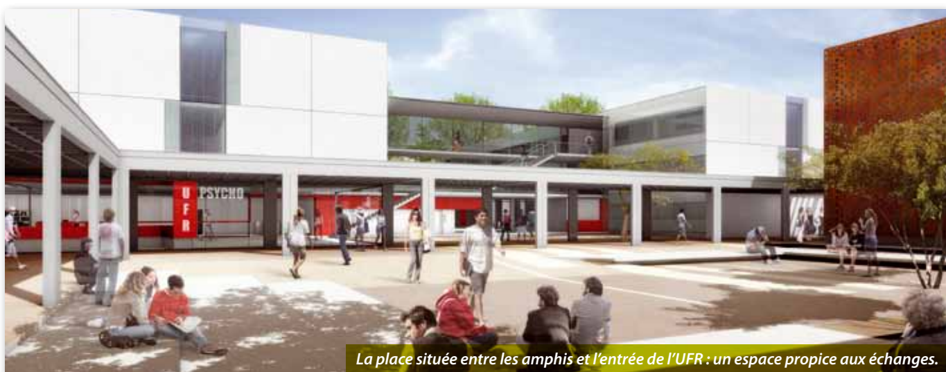
La place située entre les amphis et l'entrée de l'UFR : un espace propice aux échanges.

Ça y est. Le projet de reconstruction de l'Unité de Formation et de Recherche (UFR) de Psychologie et des 6 amphithéâtres mutualisés de l'université est validé dans ses grandes lignes. Début 2015, les étudiants, les enseignants-chercheurs et le personnel administratif bénéficieront de bâtiments lumineux, fonctionnels et agréables à vivre. Présentation du projet.