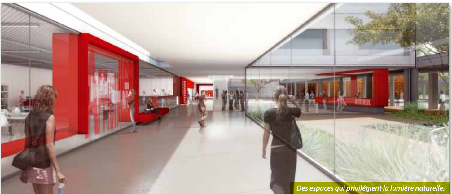
Des espaces qui privilégient la lumière naturelle.

Pour l'architecte, « la qualité des espaces s'appuie sur la présence de la lumière naturelle et de l'ouverture sur l'extérieur ». Avec ses grandes baies vitrées, ses puits de jour, ses passerelles ouvertes sur le paysage, ses résilles ajourées et bien sûr ses patios réinventés, la lumière circule librement et le regard peut s'échapper sur la rue et sur le parc.